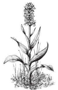
Tegeirian y Gors

Os oes rhywbeth amhosib ei adnabod, tynnwch lun ohono, gan gynnwys cymaint â phosib o'r planhigion (dail, blodau, hadau). Rhowch eich enw eich hun iddo (blodyn porffor, llun 1) nes dod o hyd i rywun sy'n gallu ei adnabod i chi.