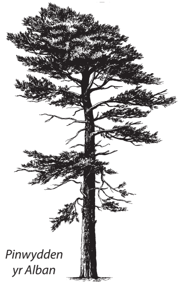
Pinwydden yr Alban

Ar ddiwedd y broses hon, byddwch yn teimlo bod y safle cyfan yn hynod beryglus, bod posib i'r